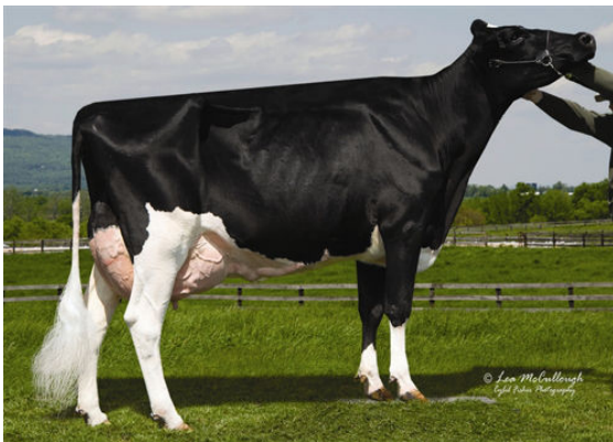
RC-LC GOLDWYN ATM THIRD DAM